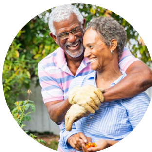
Programa de Qualidade de Vida