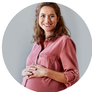
Cursos e Orientações para Gestantes

A Premium Saúde se preocupa com o bem-estar. Por isso, elaboramos programas para incentivar a escolha de uma vida saudável.