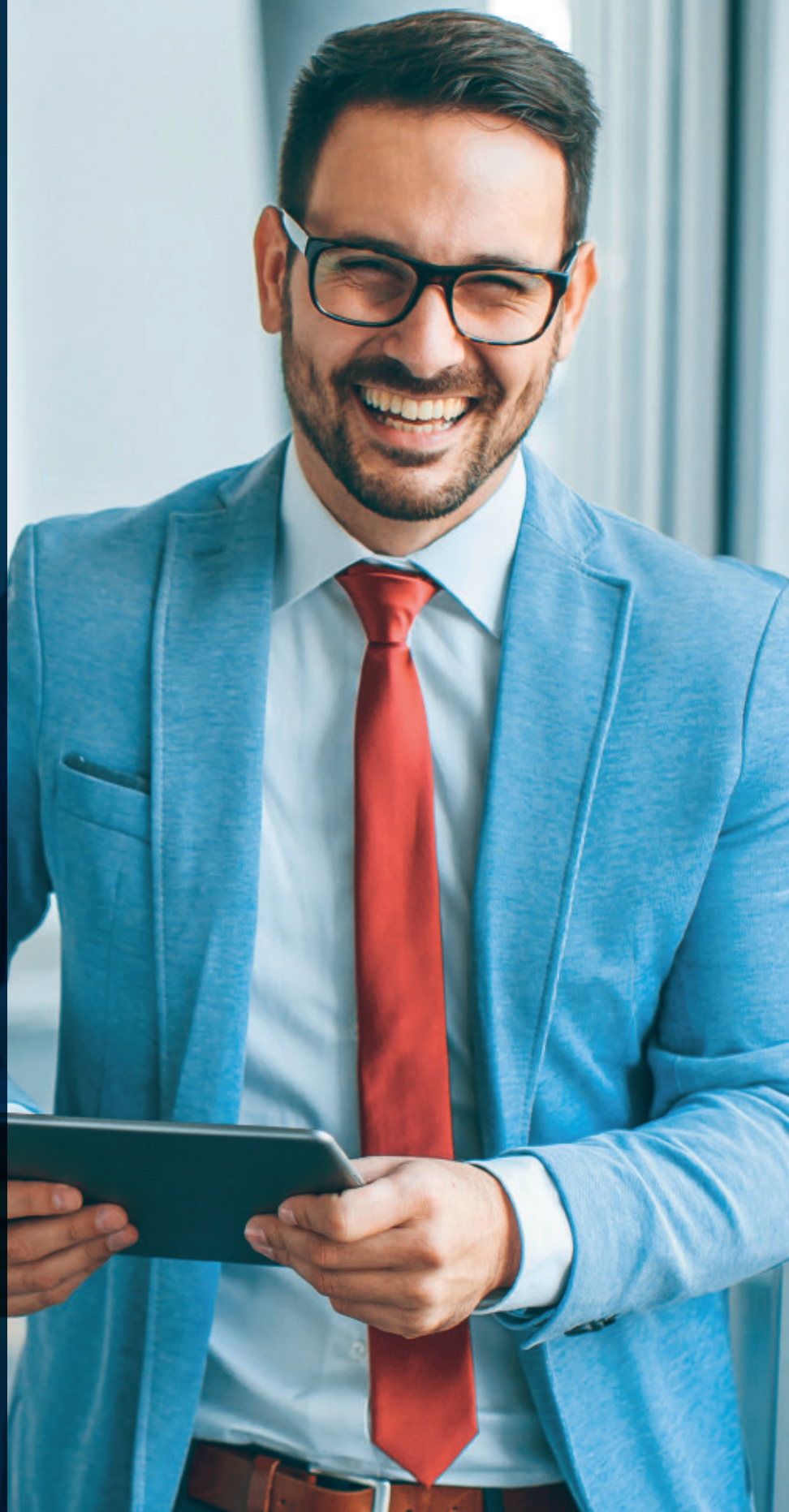
TABELA VÁLIDA PARA CONTRATAÇÃO COMPULSÓRIA